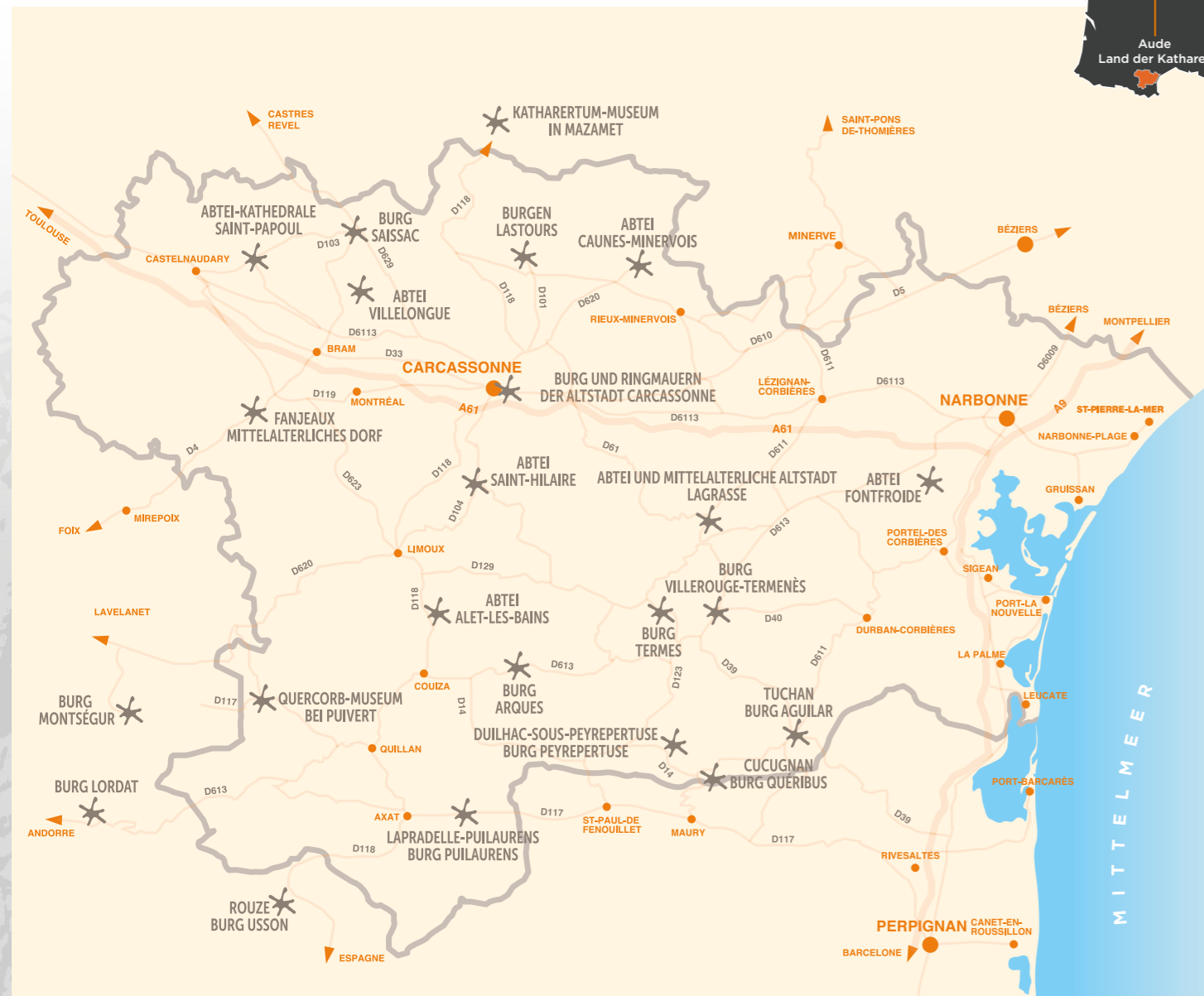
Création Agence Minelse - Mise à jour C. Mapella - Impression : Imprimerie Maraval